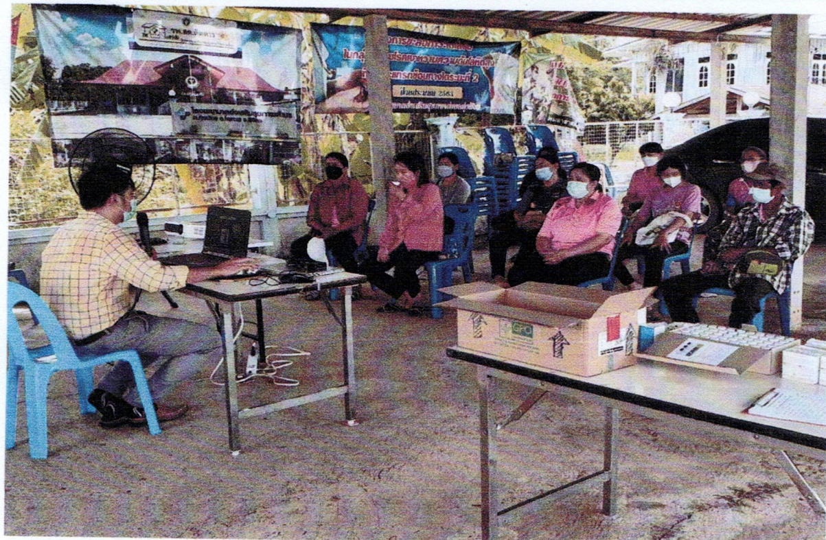
ภาพกิจกรรมจัดอบรมเชิงปฏิบัติการคณะกรรมการคุ้มครองผู้บริโภคตำบลทุ่งน้อย