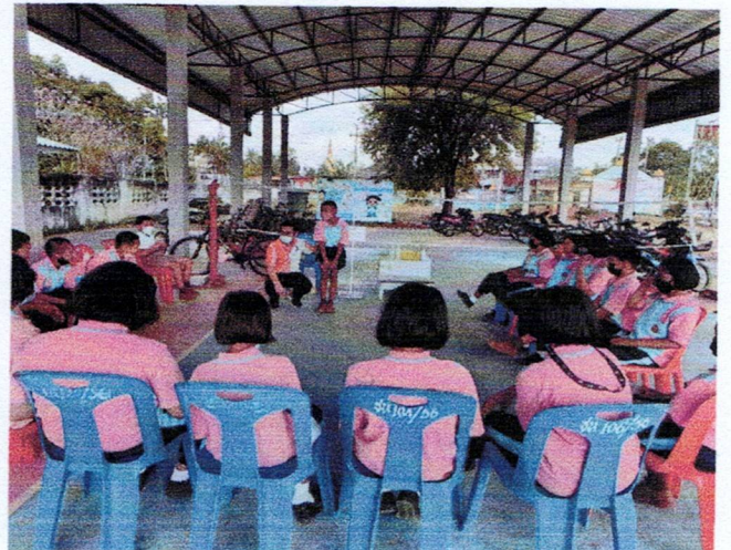
ฐานที่ 1 การตรวจร่างกาย 10 ท่า/โรคติดต่อที่พบบ่อยในโรงเรียนและวิธีป้องกัน/การป้องกันโรคโควิด