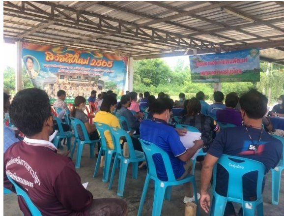
๑๙. โครงการวันเทศบาล ๒๔ เมษายน ดำเนินการแล้ว ไม่ใช้งบประมาณ