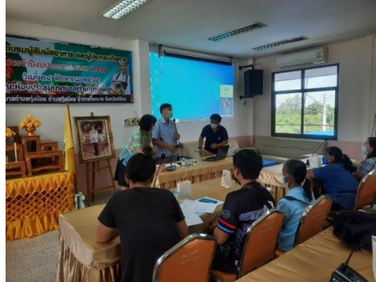
๙. โครงการปลูกจิตสำนึกคุณธรรม จริยธรรมให้กับเด็ก เยาวชนและประชาชนตำบลทุ่งน้อย ดำเนินการแล้ว ใช้งบประมาณ จำนวน ๑๗,๘๐๐ บาท