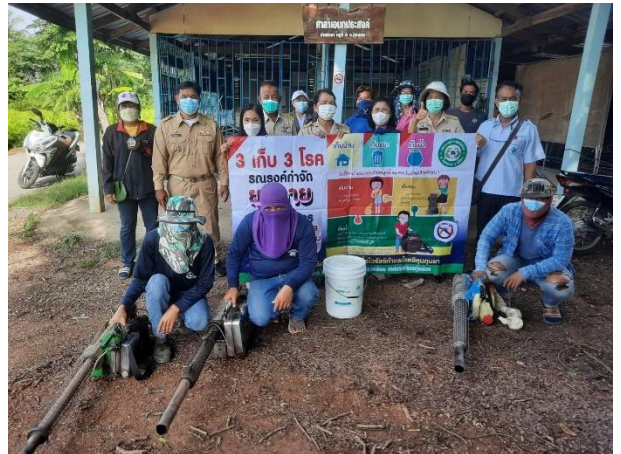
๗. โครงการสัตว์ปลอดโรค คนปลอดภัยจากโรคพิษสุนัขบ้า ดำเนินการแล้ว ใช้งบประมาณ จำนวน ๓๐,๐๐๐ บาท